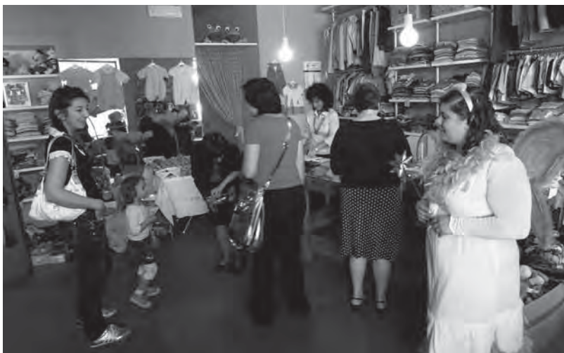
L'interno del negozio di via Frisi

C'è un negozio a Monza dove risparmio fa rima con solidarietà. È la boutique Non solo ohh, in via Frisi 9, a due passi dalle vetrine del centro. Nato nel 2005 da un'idea della Caritas di Monza, affidato alla gestione della cooperativa Novo Millennio, il negozio propone indumenti per bimbi da 0 a 10 anni usati e nuovi, a prezzi speciali. Magliette, tute, intimo, scarpine, abitini a prezzi incredibili, dai 2 ai 20 euro.