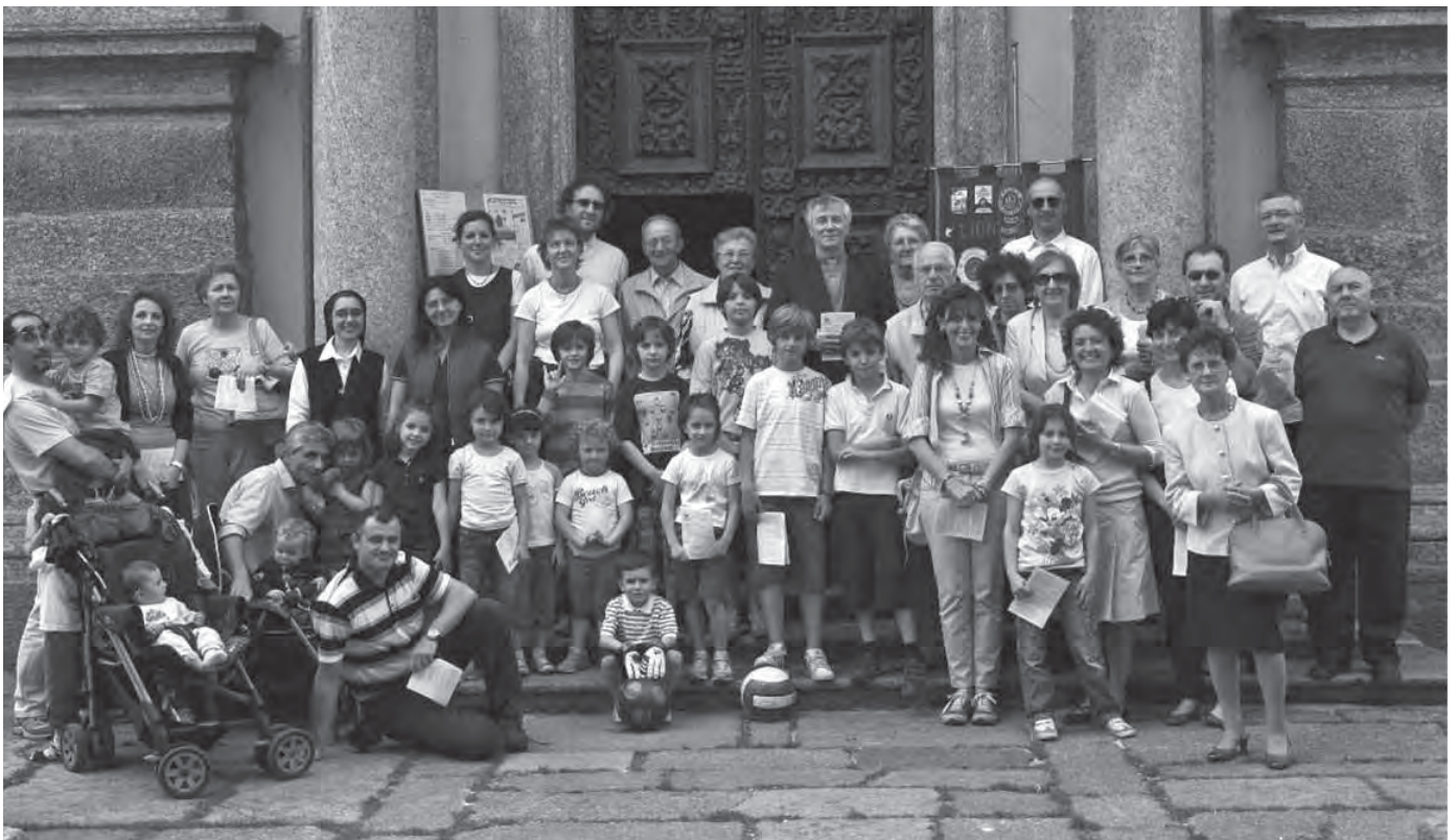
Foto di gruppo all'esterno del santuario

Se qualcuno non è riuscito a partecipare, ma desiderasse farlo non si preoccupi: ci sono altre 24 bellissime tappe da percorrere insieme!