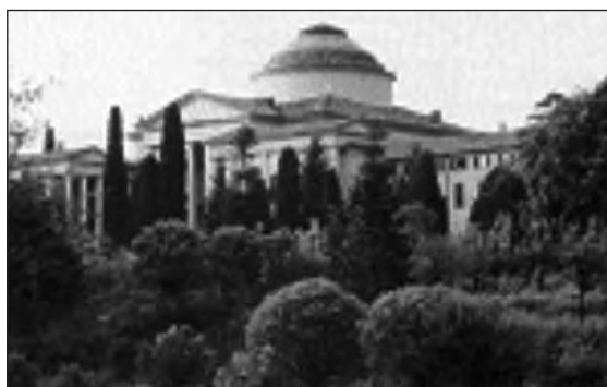
Hospice di Inverigo

Inizialmente sembrava che proprio il centro di