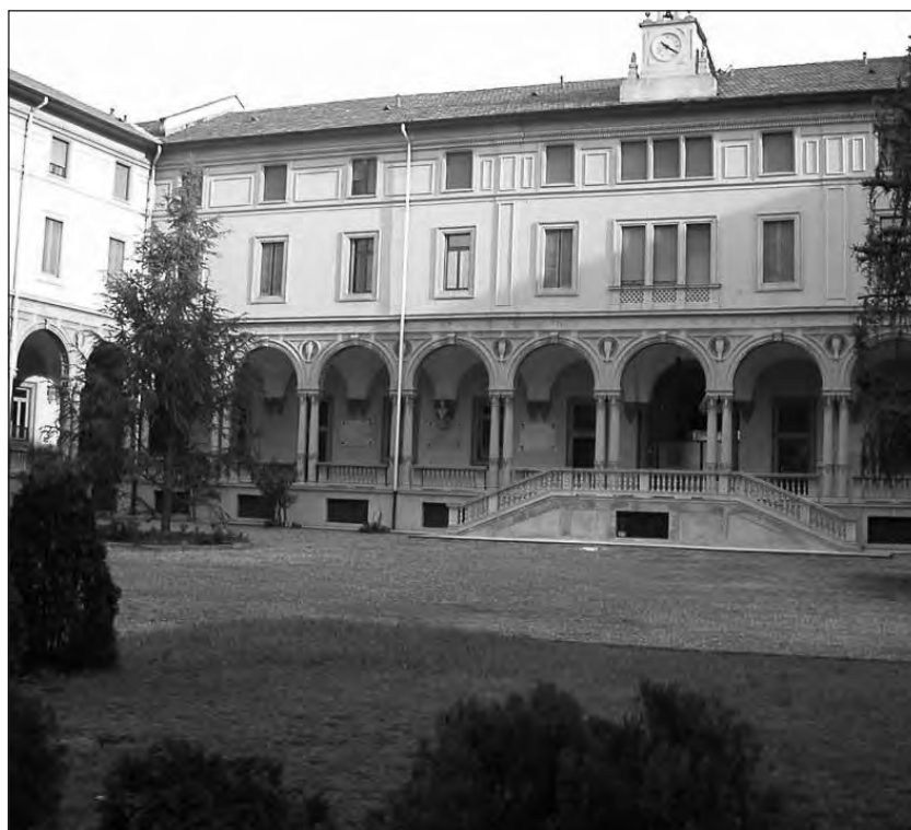
Casa madre del PIME a Milano